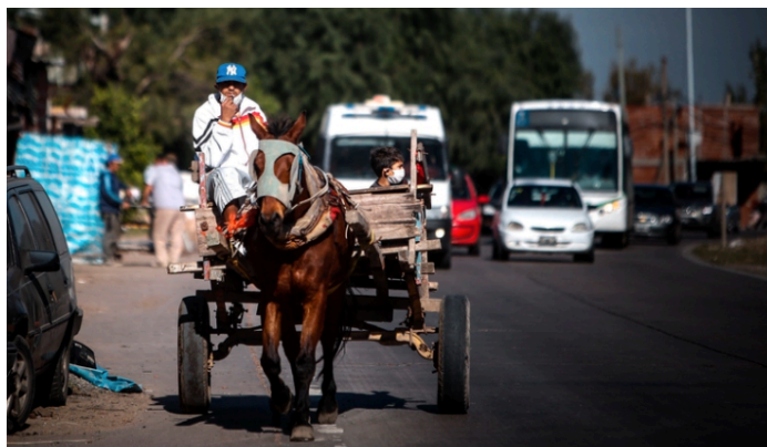
Un hombre que se dedica al reciclaje conduce su carreta a caballo el pasado 27 de mayo, en una entrada del barrio Villa Azul

En tanto, la vicepresidente de la Asamblea Permanente de Cuba, Ana Mari Machado , apuntó al bloqueo de Estados Unidos en la isla y las medidas que afectan a la economía. Pero en este contexto dijo que se enfrentó la pandemia con un diálogo permanente entre la Asamblea permanente, el gobierno y la sociedad civil. Destacó también al personal de la salud de Cuba y cuestionó la campaña de desprestigio en la región que hace Estados Unidos contra los médicos cubanos que salen en misiones a la región, como se pensó en Argentina en un momento.