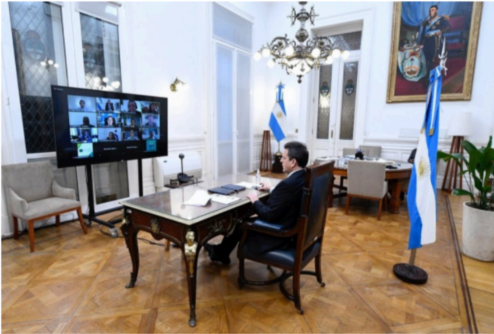
Massa encabezó la videoconferencia desde sus oficinas

Además, remarcó algunas medidas implementadas para sostener la economía argentina durante el aislamiento obligatorio: “Se incrementó el Programa de Asistencia alimentaria y económica; la suspensión de despidos, desalojos e hipotecas; y un sistema de créditos para los pequeños emprendedores, de manera tal de mantener el nivel de actividad”, entre otros.