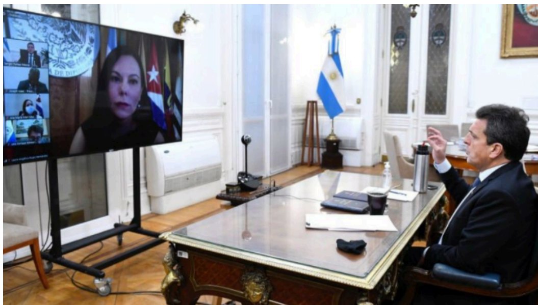
El presidente de la Cámara de Diputados, Sergio Massa, en el debate con líderes legislativos latinoamericanos.

El encuentro de los líderes legislativos de la región y el Caribe marcó un hito en la actividad parlamentaria. Massa pidió "un aporte extraordinario" de los organismos multilaterales de crédito a la región. Video.